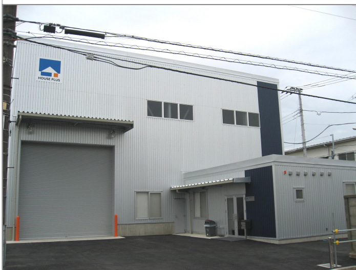
■横浜試験研究センター（全景）