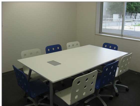
■ミーティングルーム